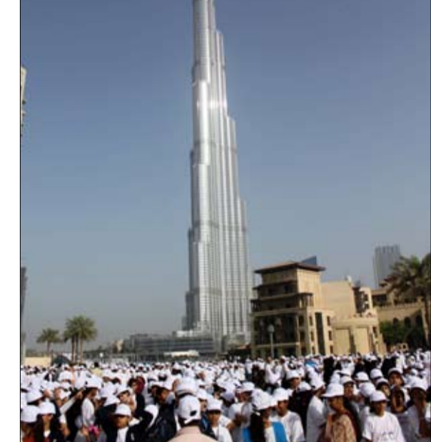
من مختلف المشاركين الذين وجدوا في هذه الاحتفالية متنفسا لممارسة بدنيا وصحيا.

وضمنت احتفالية العام الماضي القيام بمسيرة للمشي في منطقة الخواثيج، كما أقيمت فعاليات ضخمة في حديقة زعبيل والشاطيء المفتوح أمام حديقة أم سقيم تضمنت العديد من التدريبات والأنعاب البدنية والرياضية إلى جانب توفير معدات حديثة، كما تم إقامة مسيرة