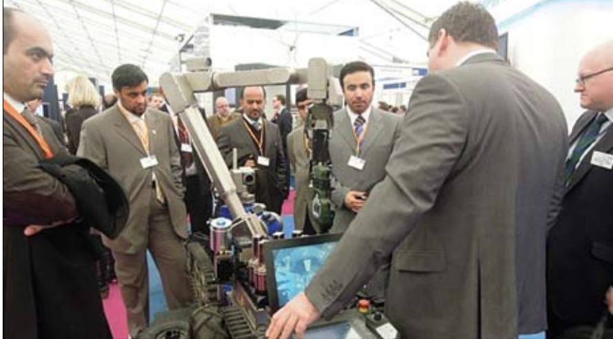
المشترك. وقال اللواء الرئيسي إن معرض الأمن والأعمال الشرطة يعتبر من المعارض الرئيسية في المملكة المتحدة للأجهزة الأمنية والمتخصصة في مجال تقنيات الأمن والسلامة مشيرا إلى أنه عرض في المعرض الخدمات التي تقدمها سيارات النجدة والإسعاف.

قام وفد من دولة الإمارات العربية المتحدة برئاسة اللواء أحمد ناصر الرئيسي مدير عام العمليات المركزية في القيادة العامة لشرطة أبوظبي رئيس اللجنة العليا لتطوير الأنظمة الإلكترونية القضائية بزيارة لمعرض الأمن والأعمال الشرطة الذي أقيمت فعالياته أخيرا في مدينة فانينوروج في المملكة المتحدة. واطلع الوفد على أحدث الأجهزة والتقنيات والمعدات الحديثة المعروضة في المعرض وتبادل الخبرات في المجالات الأمنية بين مختلف الأجهزة والمؤسسات المشاركة. كما تم التباحث في ما بينها في الموضوعات ذات الاهتمام