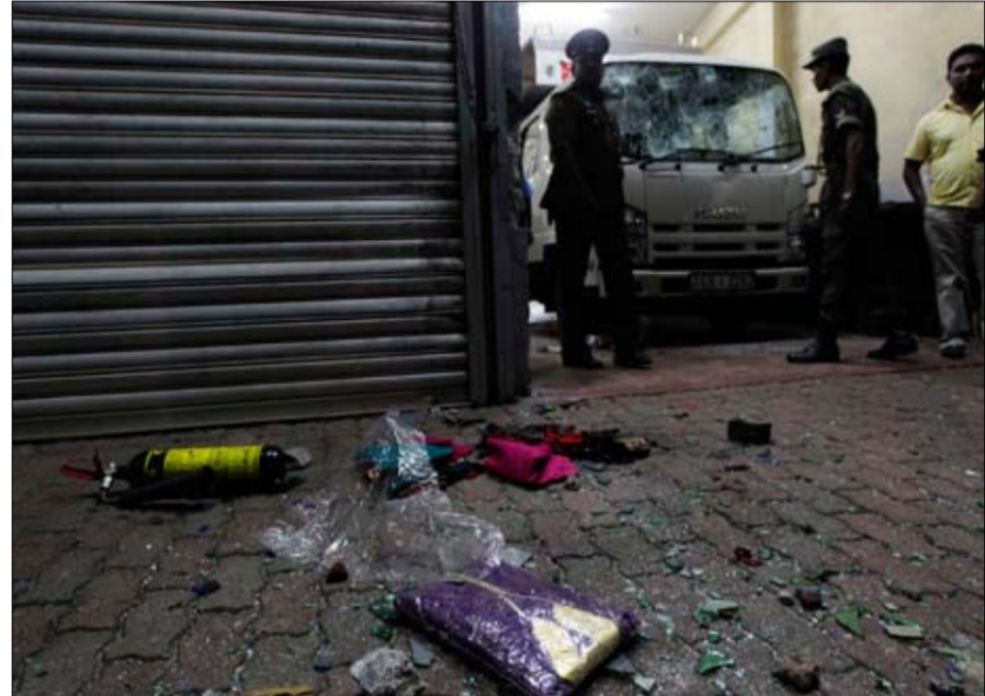
سقوط مئة الف قتيل على الاقل.

في عمل هو الاخير في سلسلة هجمات مماثلة. وقالت الشرطة ان ثلاثة اشخاص على الاقل جرحوا عندما هاجمت مجموعة من السنهاليين الذين يشكلون اغلبية في الجزيرة الواقعة في المحيط الهندي، بالحجارة محلا لبيع الملابس قبل