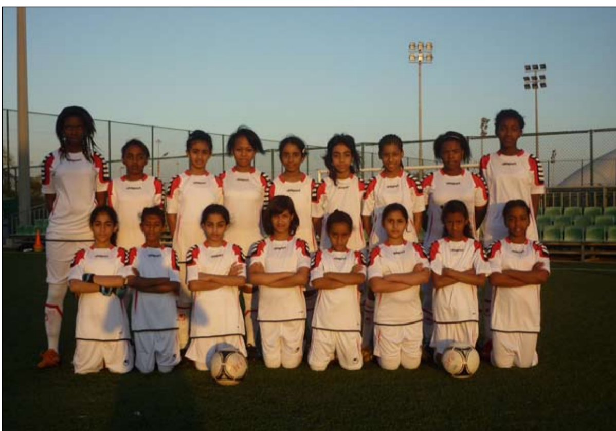
وأعربت بوشلاخ عن ارتياحها لمشاركة منتخب الفتيات في أول بطولة رسمية تحت إشراف أسوي، الأمر الذي يؤكد على خططنا الهادفة في تنمية وتكوين المنتخبات على صعيد المراحل والعمل الدؤوب خلال الفترة الماضية.