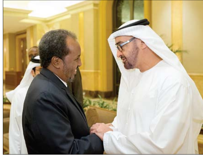
محمد بن زايد خلال استقبله الرئيس الصومالي

للتخفيف من معاناة مرضى القلب حملة العطاء العالمية تعزز من مهامها الإنسانية في مصر •• أبوظبي-وام: عززت حملة العطاء العالمية مهامها الإنسانية في مصر للتخفيف من معاناة مرضى القلب من خلال إجراء مئات من العمليات الجراحية تحت إشراف فريق طبي وجراحي إماراتي ومصري وفرنسي بالتعاون مع المؤسسات الصحية والمستشفيات الجامعية المصرية في نموذج مميز للعمل التطوعي المشترك في المجالات الصحية. وتأتي هذه الحملة استكمالاً للمبادرات الإنسانية التي تقدمها مبادرة زايد العطاء في مختلف دول العالم ويأشرف المجموعة الإماراتية العالمية للقلب والوفاة العالمية للقلب والتي تم من خلالها تقديم خدمات علاجية ووقائية للمرضى ومن في مختلف أنحاء العالم بغض النظر عن اللون أو الجنس أو الدين في مختلف دول بهدف ترسيخ ثقافة العطاء والعمل التطوعي والإنساني. (التفاصيل ص2) 10 مليار و 560 مليون درهم لإحلال وتشييد 261 مدرسة بـ 17 عاما نصيب دبي 17 % و 8 % للإحلال منها المباني القروية فلا محل لها من الصيانة •• دبي- محسن راشد تكتشف الخطة الشمولية التي أعدها إدارة الأبنية والمرافق التعليمية في وزارة التربية والتعليم، عن أكثر من ٢٦١ مشروعاً جديداً من إحلال واستحداث ودمج في مدارسها بالمناطق التعليمية دبي- الشارقة، عجمان، أم القيوين، الفجيرة، ورأس الخيمة، حيث بلغ عدد مشاريع الإحلال ١٥٢ مشروعاً، والاستحداث بلغ ١٠٩ مشروعاً. وذلك من خلال المسح الميداني الذي استهدف ما يقرب من ٣٥٠ منطقة سكنية على مستوى دبي والمناطق الشمالية، لتحديد المشاريع المقترحة للمباني المدرسية الجديدة، ومبان مدارس الإحلال خلال ١٧.١٢ عام المقبلة. (التفاصيل ص٣)